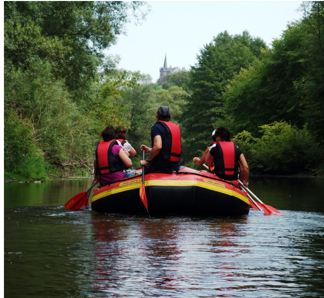
... mit Führungskompetenz gemeinsam das Ziel erreichen